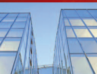
Hotel Astoria Pilatusstrasse 29 Luzern → www.astoria-luzern.ch

Sie erhalten eine schriftliche Bestätigung Ihrer Teilnahme inklusive Informationen zur Anreise und zum Transfer ins Hotel Astoria.